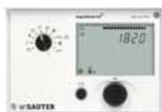
SAUTER equitherm® EQJW125