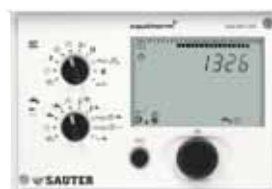
SAUTER equitherm® EQJW135